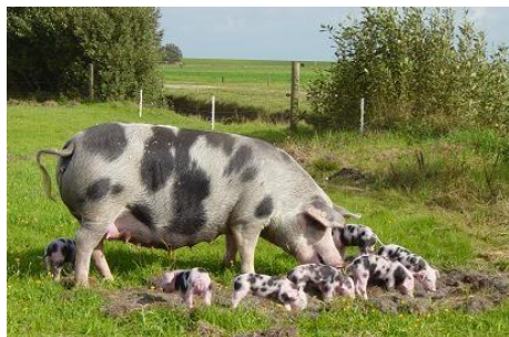
5 of meer vlekken