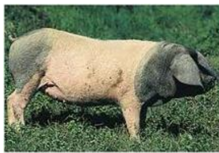
1 tot 4 vlekken